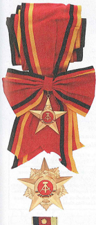
Deutsche Demokratische Republik, Orden „Großer Stern der Völkerfreundschaft“, mit der originalen Verteilungsurkunde (dieser Orden wurde nur 163 mal verliehen).

ges einige hundert Zusatzbildungen, die einen vertieften Einblick in die umfangreichen Sammlerbestände geben.