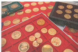
Interessante Investmentobjekte bei Rapp