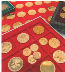
Interessante Investmentobjekte bei Rapp

wenige Exemplare wurden damals, also vor rund 60 Jahren, den Münzgestaltern und ausgewählten hohen Politikern als Schaustück ausgehändigt. Nur so kamen einige wenige Exemplare überhaupt in den Umlauf. Bis heute ist nur ein anderes Paar mit der Jahreszahl 1956 bekannt, welches sich in der Sammlung «L'Excellence Suisse» befindet. Das bei Rapp neu aufgetauchte Paar von 1959 befand sich seit dem Jahre 1959 im Familienbesitz und ist wohl das einzig bekannte Paar auf dem freien Markt,